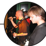
Mitt engagemang och deltagande i föreningslivet har haft betydelse för: