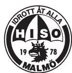
HISO - Handikappidrottens Samarbetsorganisation i Malmö